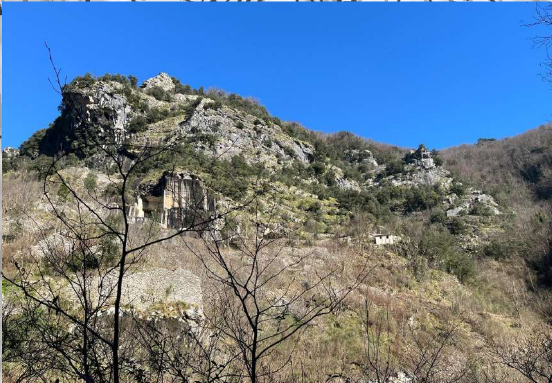
Affioramenti rocciosi (versante cava Piastraio)