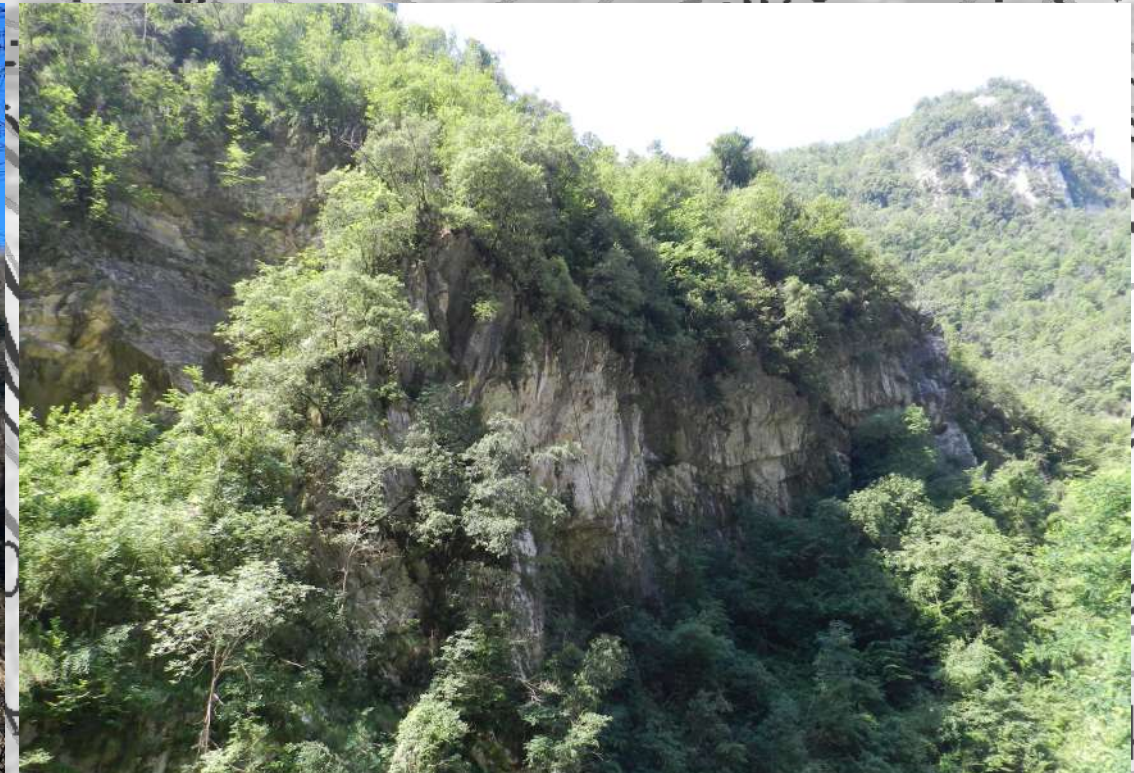
bosco misto di latifoglie (versante cava Rondone)