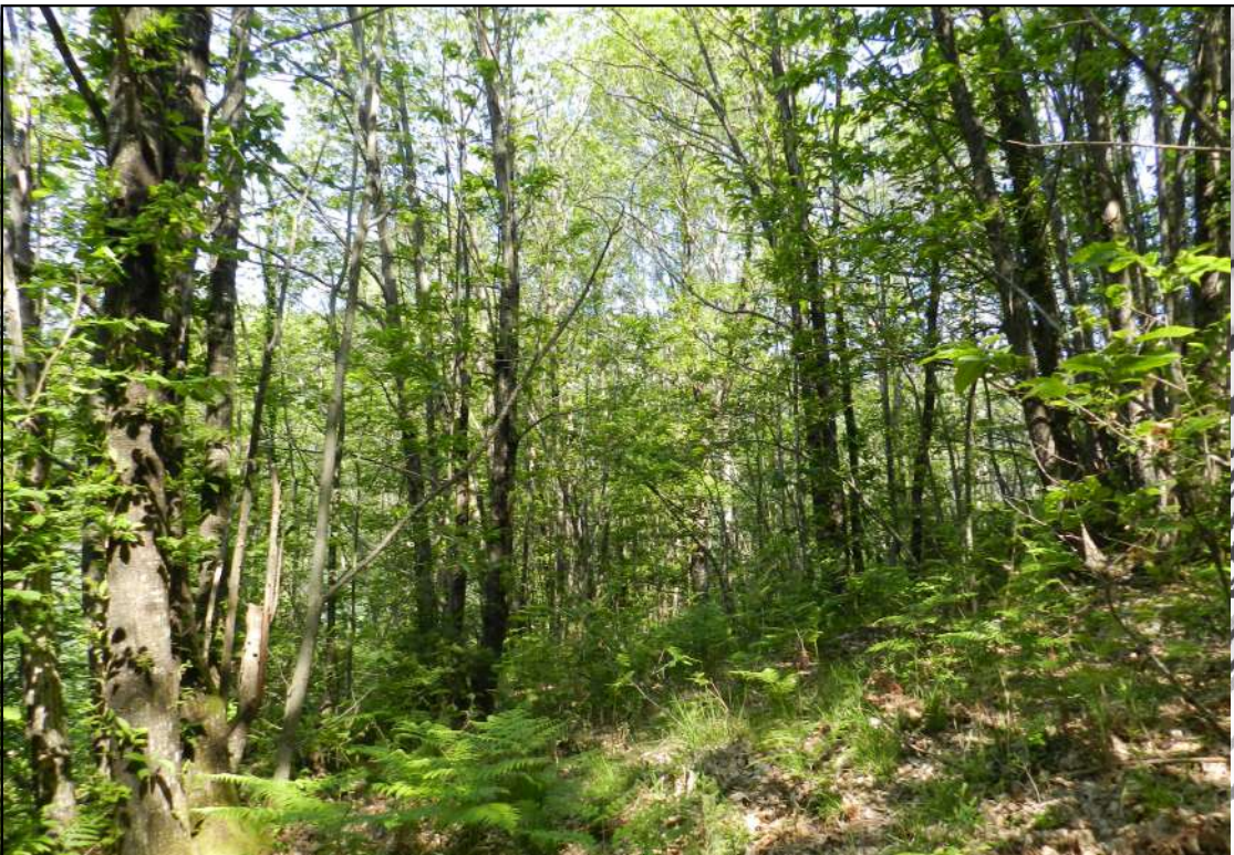
Castagneto (versante cava Rondone)