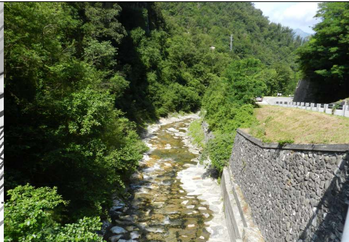
vegetazione riparia e di greto F.Vezza