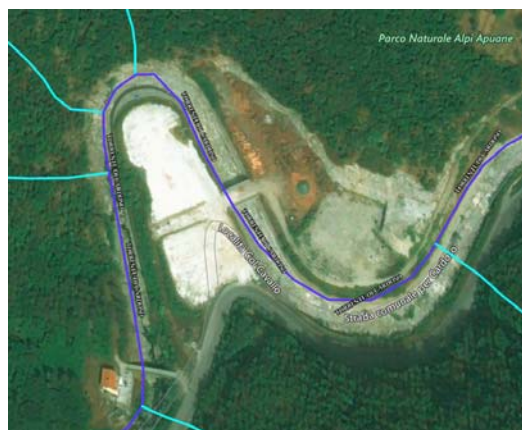
Figura 9 - Reticolo di gestione L.R. 79/2012 agg. DGRT 135/2017

2g G.2 3t S.2 Aree con assenza di forme e processi geomorfologici attivi e/o quiescenti, nelle quali sulla base di valutazioni geologiche, litotecniche e clivometriche, sono prevedibili limitati processi di degrado superficiale riconoscibili o neutralizzabili a livello di intervento diretto. Aree in cui sono possibili fenomeni di amplificazione stratigrafica degli effetti sismici